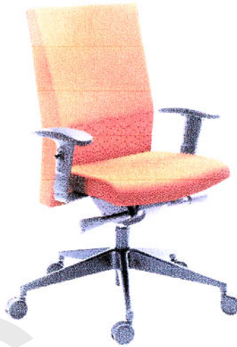
Fot. 1. Krzesło obrotowe PLAYA

Krzesła obrotowe serii PLAYA to fotele na teleskopie gazowym z oparciem połączonym z siedziskiem przy wykorzystaniu synchronizmu, który w połączeniu z możliwością regulacji wysokości siedziska i oparcia oraz kąta nachylenia oparcia, a także odpowiednimi profilami siedziska i oparcia zapewnia możliwość dostosowania warunków siedzenia do anatomicznych potrzeb użytkowników. Zastosowany mechanizm umożliwia siedzenie dynamiczne i przyjmowanie zrelaksowanej, odchylonej do tyłu pozycji ciała.