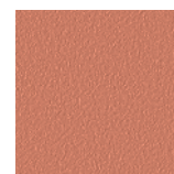
Terracotta RAL 3012