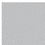
Light Grey NCS S 2500-N