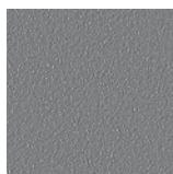
Grey NCS S 6500-N