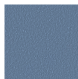
Blue RAL 5014