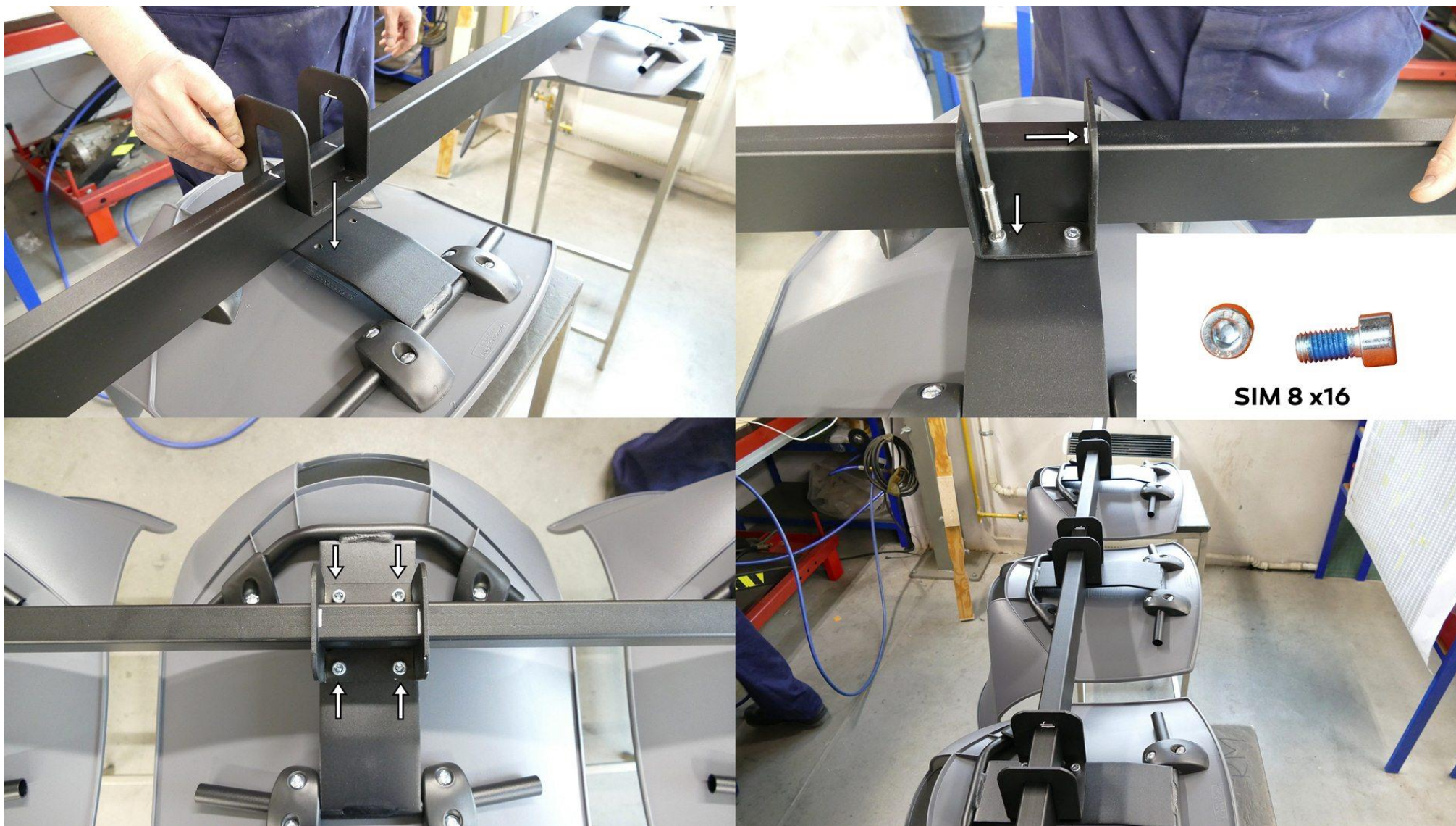
Przykręcić łącznik śrubami SIM 8x16mm/ Schrauben Sie den Stecker mit SIM 8x16mm Schrauben fest / screw the connector with SIM 8x16mm screws.